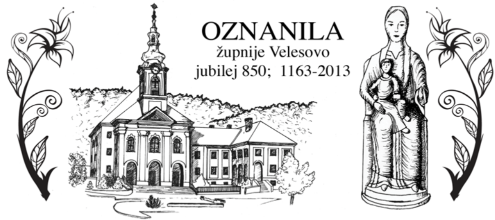
Grafika: Sabina Zorman

Izdal in odgovarja: Slavko Kalan, župnik; tel: 04/25-28-500 ali 041/755-404 e-naslov: slavko.kalan@rkc.si; Župnijska spletna stran: www.zupnija-velesovo.si ŽUPNIJSKI TRR : SI 56 0433 1000 3327 797 OTP BANKA