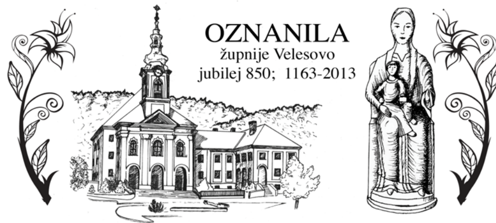
Grafika: Sabina Zorman

KDAJ BO LETOŠNJI ORATORIJ? Vsebina letošnje zgodbe »Heidi« je vzeta iz pravljice vsebine z istim naslovom. Naši mladi oratorijski prostovoljci - animatorji so se odločili, da bo oratorij, tako kakor običajno prvi »celi« teden v mesecu juliju. Letos je to od nedelje 5. julija do petka 10. julija 2026.