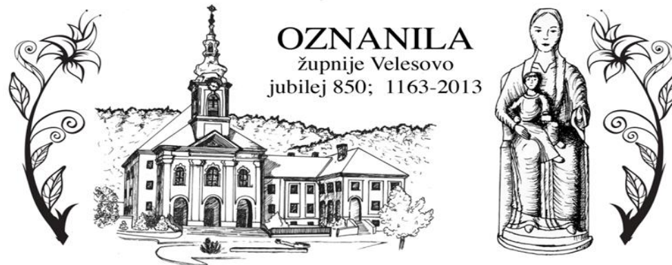
Grafika: Sabina Zorman

Izdal in Odgovarja: Slavko Kalan, župnik; tel: 25-28-500 ali 041/755-404 elektronski naslov: slavko.kalan@rkc.si ; ŽUPNIJSKA SPLETNA STRAN: www.zupnija-velesovo.si