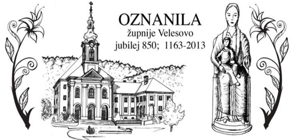
Grafika: Sabina Zorman

STRAN: www.zupnija-velesovo.si ŽUPNIJSKI TRR: SI 56 0433 1000 3327 797